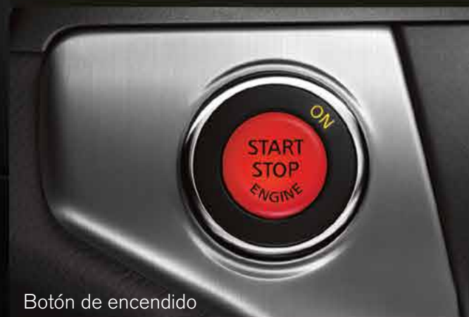
Botón de encendido