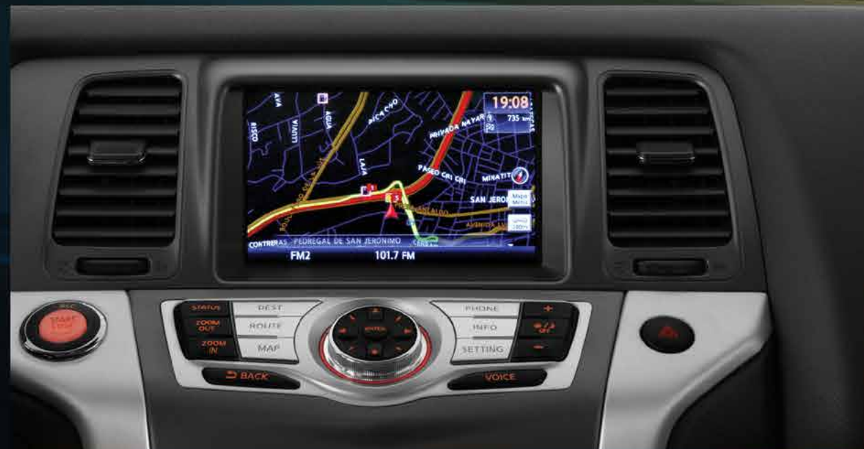
Sistema de Navegación Touch

Define tu destino; Nissan Murano® te lleva hasta él gracias a su avanzado Sistema de Navegación Touch que indica sitios de interés y cuenta con reconocimiento de voz en 3 idiomas (español, inglés y francés) y monitor de 7" VGA (Video Graphic Array). Además, la computadora de viaje te permite conocer la temperatura exterior , el consumo de combustible y la velocidad promedio .