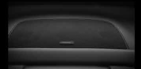
Sistema de audio Premium Bose®