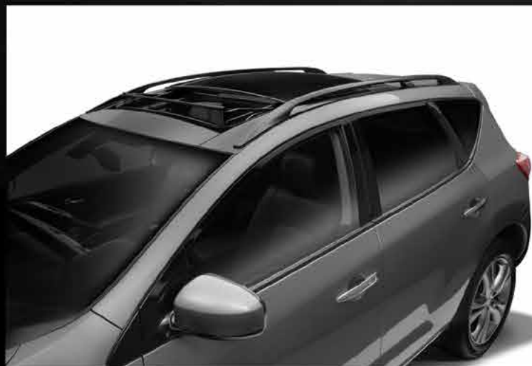
Rieles en todo

La funcionalidad es máxima con los faros de niebla y los espejos laterales que se ajustan eléctricamente . Los rieles en todo te permiten llevar lo que quieras de manera más fácil.