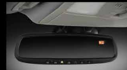
Espejo retrovisor con HomeLink®