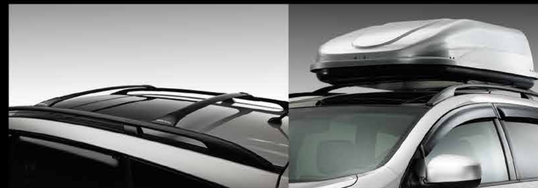
Barras en toldo

H az notar tu toque personal con los accesorios originales para Nissan Murano® .