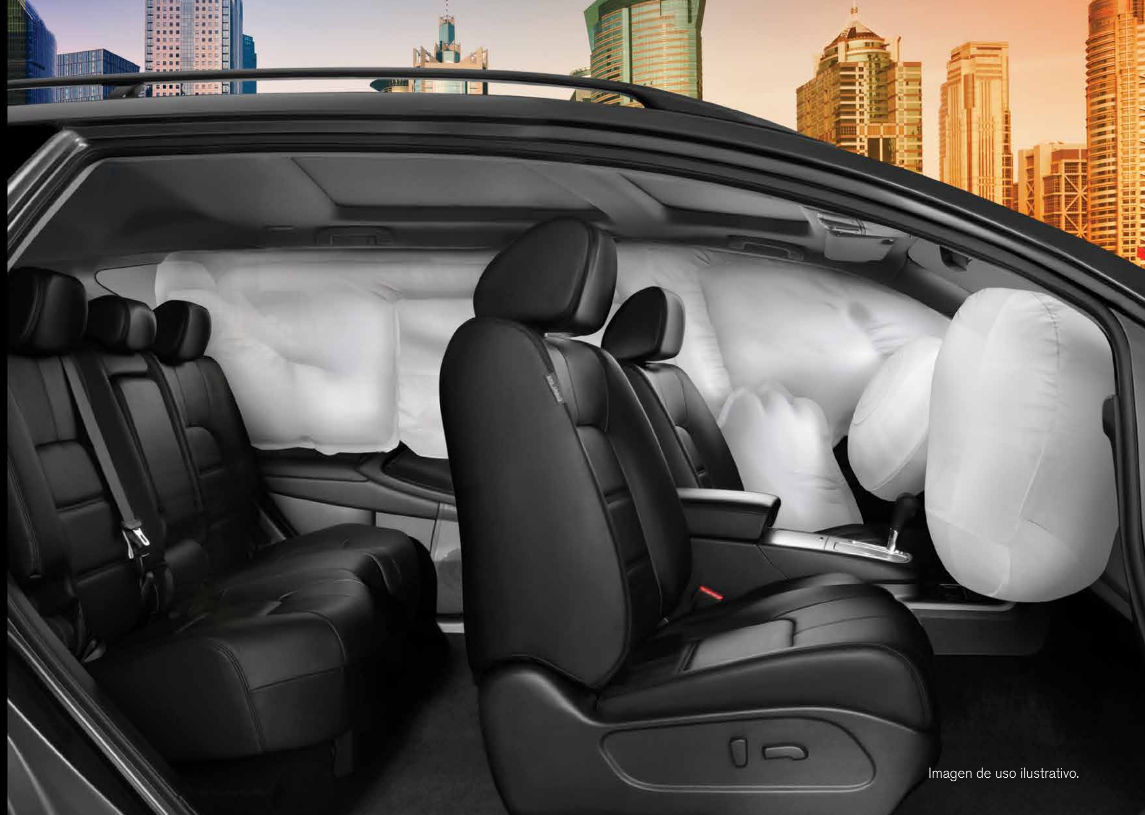
Imagen de uso ilustrativo.