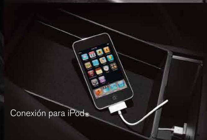
Conexión para iPod®