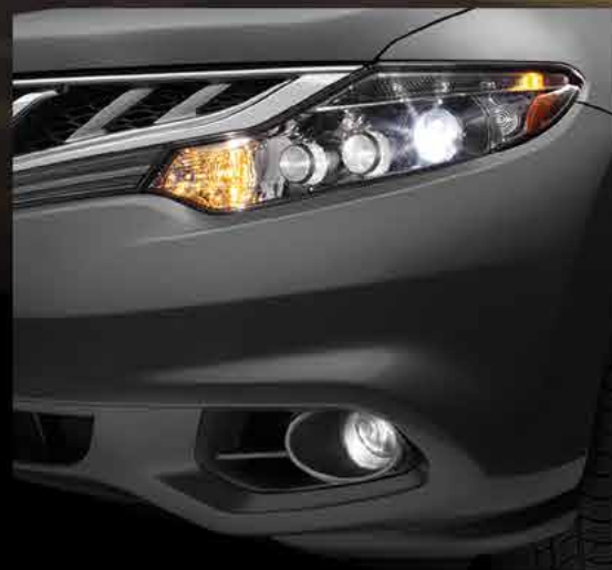
Faros de luz Bi-Xenón