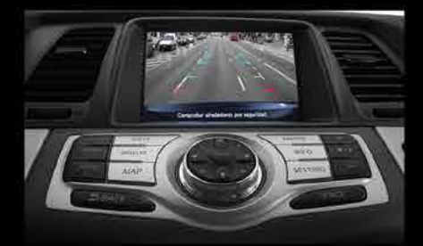
Cámara de visión trasera con pantalla de 7"