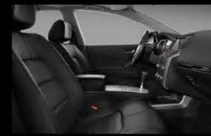
Asientos forrados con piel

Su gran espacio interior te conquistará ya que los asientos traseros cuentan con sistema de ventilación y son abatibles.