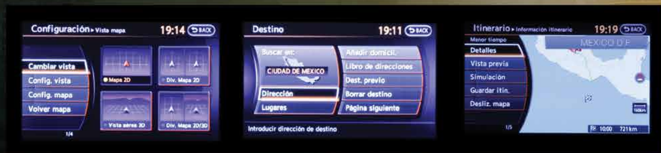
Configura la pantalla