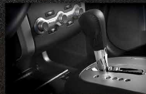
Transmisión Xtronic® CVT

Para poder llegar adonde quieras, necesitas tener un gran motor como el de Nissan Murano®: VQ35 de 6 cilindros, 260 hp y 240 lb-pie de torque. La transmisión Xtronic® CVT maximiza el desempeño del vehículo y la economía del combustible por medio de un avanzado sistema de poleas que te permite una aceleración instantánea y constante sin perder potencia. La versión Exclusive cuenta con el Sistema Intuitivo de Tracción Integral (AWD) que distribuye la fuerza de la tracción en las 4 ruedas. De esta manera obtienes mejor funcionamiento ya que el vehículo se adapta a cualquier superficie.