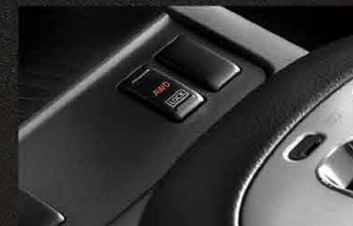
Sistema Intuitivo de Tracción Integral (AWD)